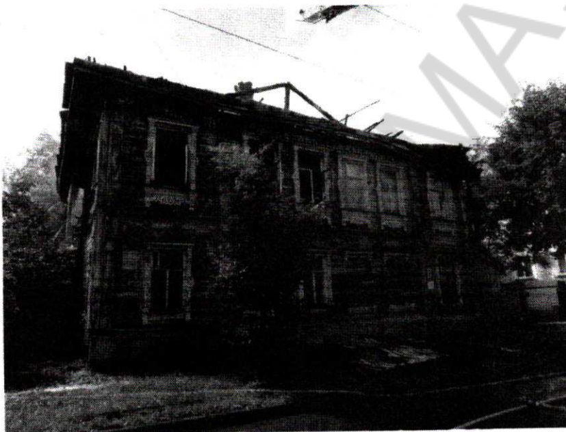
Главный (северный) фасад

Фотографическое (иное графическое) изображение объекта культурного наследия